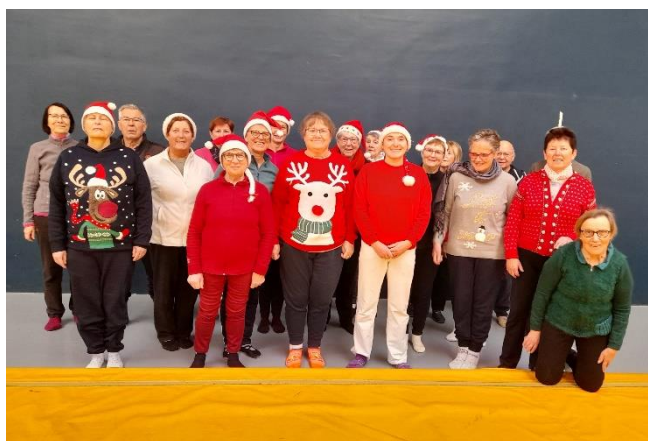
La gym douce, dernier cours 2022 aux couleurs de Noël